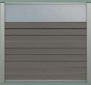
45 cm opaal glas