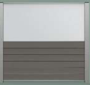
90 cm helder glas